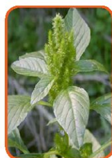
تاج خروس ریشه